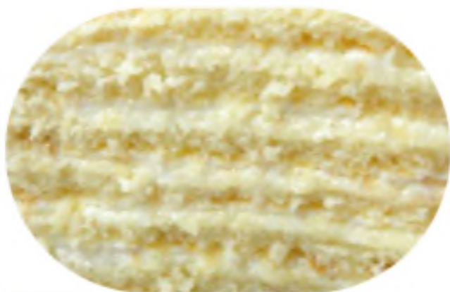
МОЛОЧНАЯ ДЕВОЧКА 1400 р /1 кг

Тонкий бисквит с нежным сливочным кремом с фруктами (ананас, вишня, персик) и орехом фундук