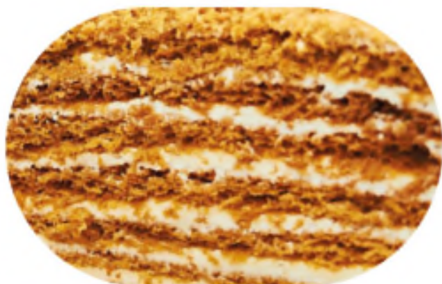
МЕДОВЫЙ 800 р / 1 кг

Удивительное сочетание сметанного крема и медовых коржей