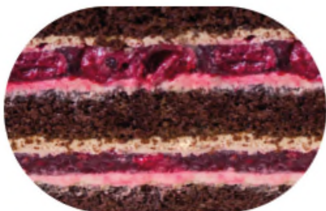
ШОКОЛАДНЫЙ ШИК 1700 р /1 кг

Шоколадный бисквит, пропитанный сахарным сиропом, с прослойкой ягодного желе и шоколадного крем чиз