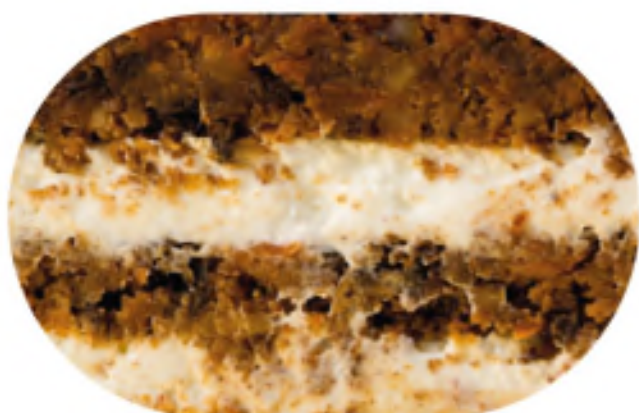
МОРКОВНЫЙ 1300 р / 1 кг

Пряный морковный бисквит с кремом Чиз, грецким орехом и изюмом