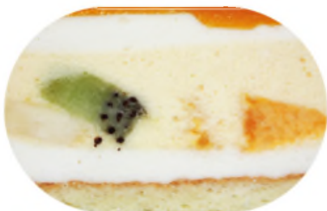
ЭКЗОТИКА 2600 р / 1 кг

Экзотический мусс под желе из манго-маракуйи