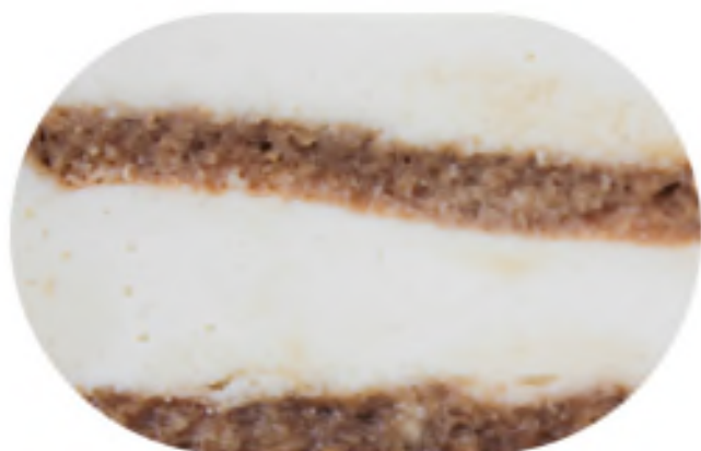
ТИРАМИСУ 2700 р / 1 кг

Мусс из сыра Маскарпоне с добавлением ликера Калуа на пропитанном кофе бисквите