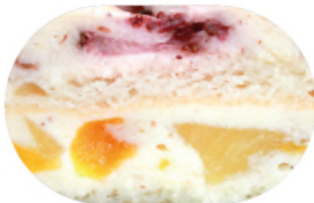
ВЕНЕЦИЯ 980 р /1 кг

Тонкий ванильный бисквит с желе из клубники и апельсина, с ванильным крем чиз