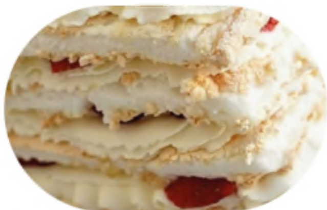
МЕРЕНГОВЫЙ со свежими ягодами 3200 р / 1 кг

Воздушный торт из безе и ягод со сливочно-сырным кремом