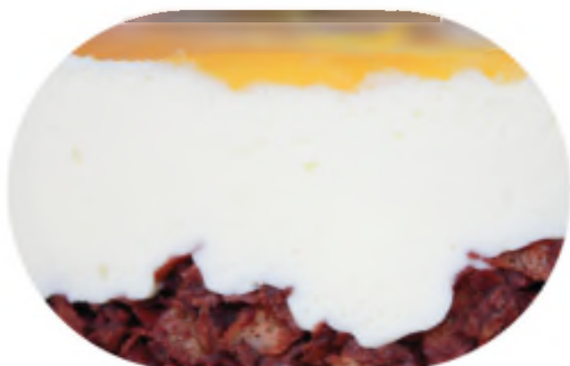
ЧИЗКЕЙК 2200 р / 1 кг

Экзотический мусс под желе из манго-маракуйи