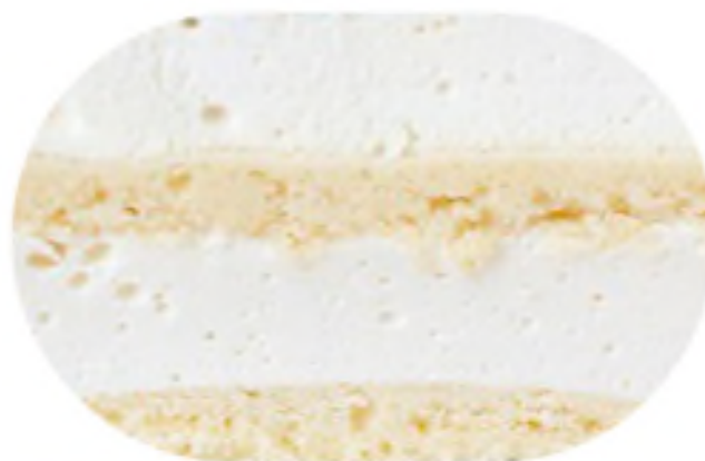
ПТИЧЬЕ МОЛОКО 1200 р /1 кг

Нежные бисквиты на основе сгущенного молока со сметанным кремом