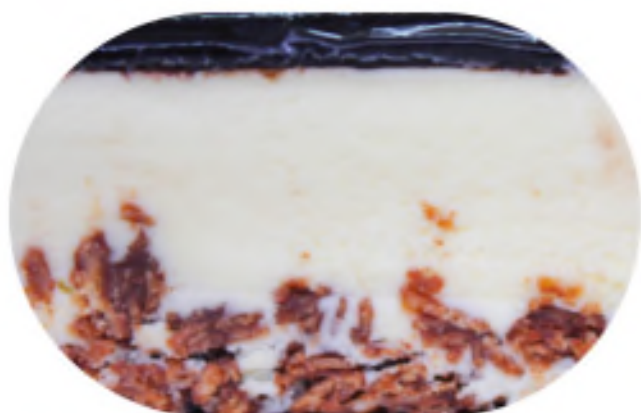
БЛЭКДЖЕК 3100 р / 1 кг

Сочетание воздушного мусса из белого шоколада в зеркальной глазури