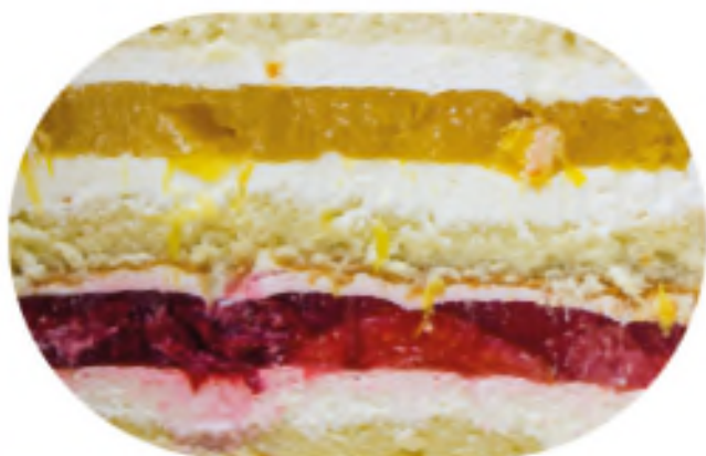
ШИФОНОВАЯ ВАНИЛЬ 1200 р /1 кг

Утонченный орехово-молочный мусс под ароматным бисквитом и глянсажем из фундука