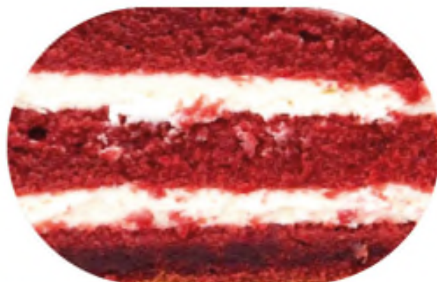
КРАСНЫЙ БАРХАТ 1200 р / 1 кг

Удивительное сочетание сметанного крема и медовых коржей