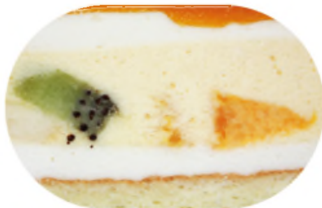
ЭКЗОТИКА 2300 р / 1 кг

Мусс из сыра Маскарпоне с добавлением ликера Калуа на пропитанном кофе бисквите