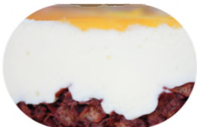
ЧИЗКЕЙК 2400 р / 1 кг

Сырный торт на хрустящем шоколадном корже под желе из маракуйи