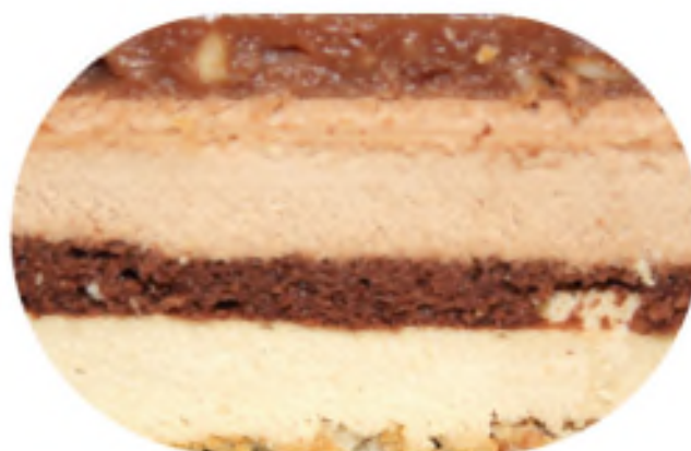
МАДАГАСКАР 2100 р /1 кг

Шоколадный бисквит, пропитанный сахарным сиропом, с прослойкой ягодного желе и шоколадного крем чиз