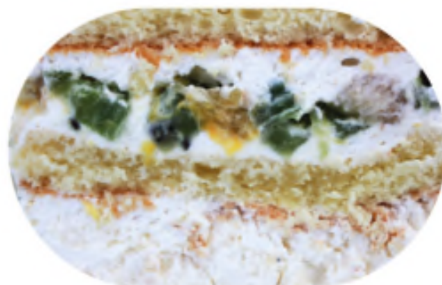
МАЖЕСТИК 1100 р / 1 кг

Сырный торт на хрустящем шоколадном корже под желе из маракуйи